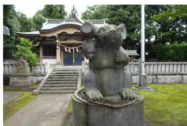
北新羽杉山神社と狛ねずみ